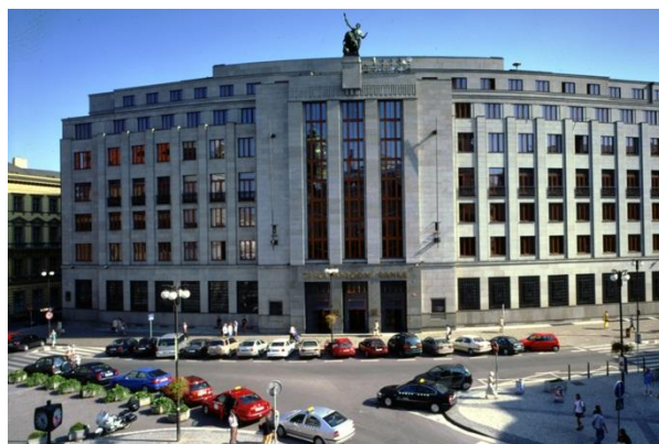
Obrázek 1 Hlavní budova ČNB